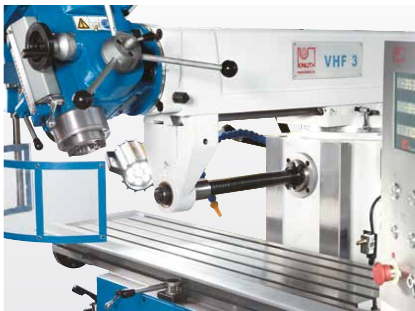
Ax de frezare orizontal cu suport pentru dornuri de frezare lungi