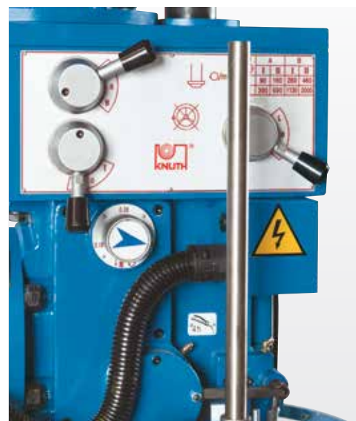
Avans automat al pinolei cu 3 trepte de viteza