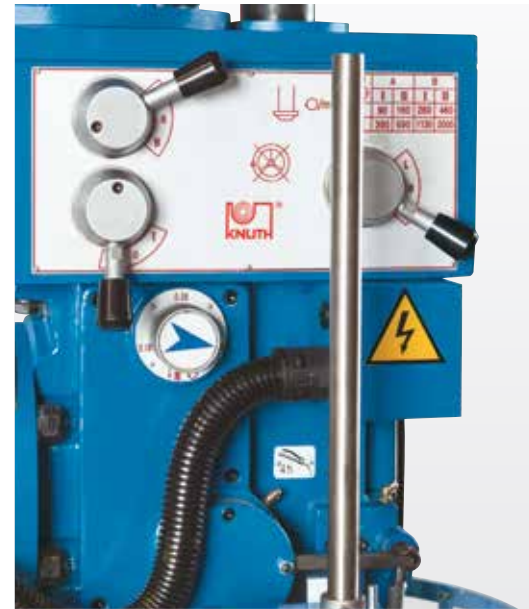
Automatischer Pinolenvorschub mit 3 Stufen