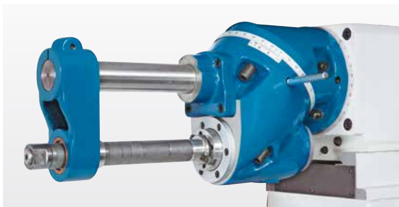
Dispozitiv pentru frezare pe orizontala ( dotare standard)