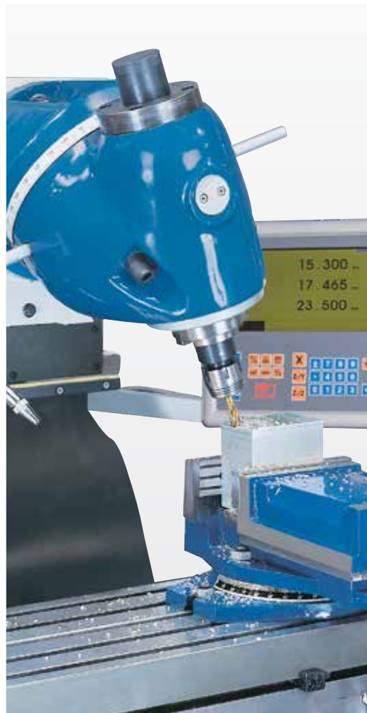
Głowica frezarska przechyłana w 2 płaszczyznach