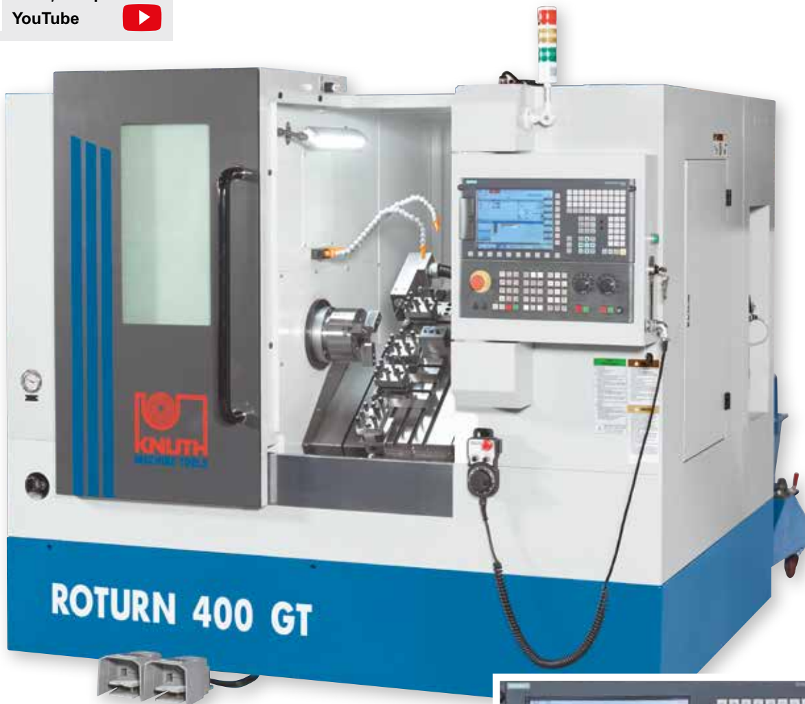
Fig. Roturn 400 GT, cu accesorii optionale