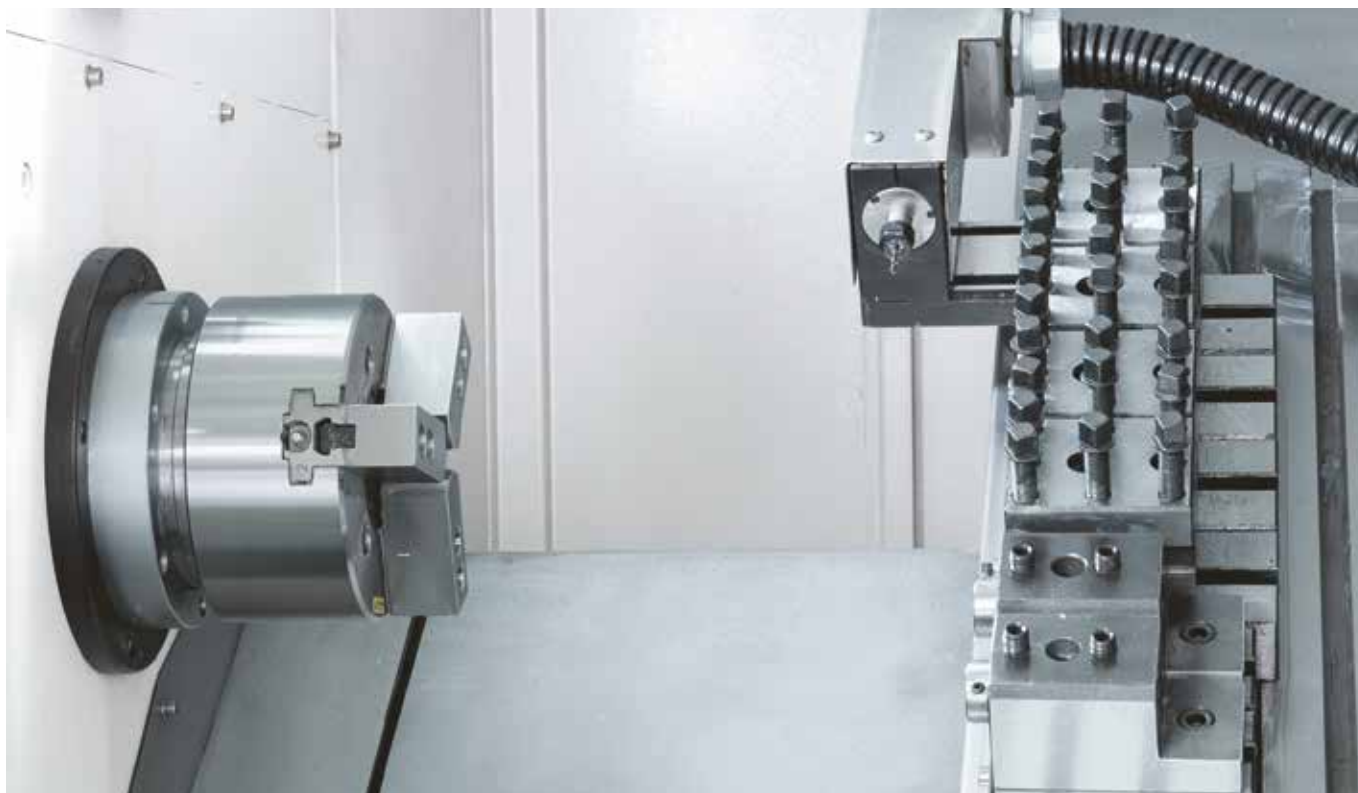
Schimbator linear de scule echipat si cu o scula antrenata