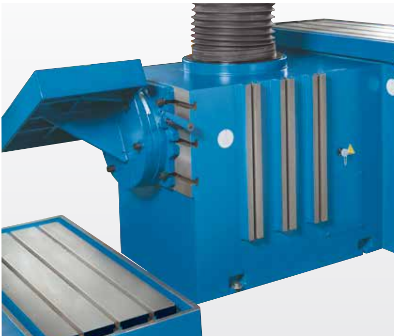
Zusätzliche Aufspannflächen lassen keine Wünsche offen