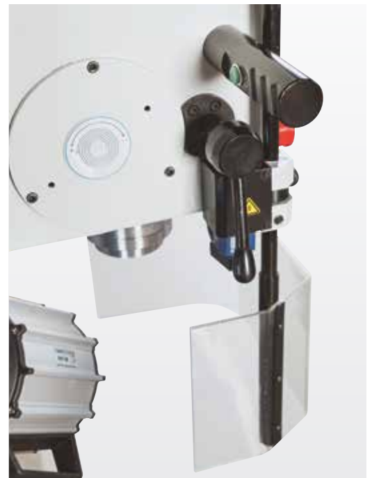
Überzeugend einfaches Handling und ausgereifte Funktion