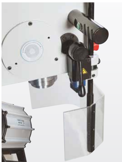
Přesvědčivě snadná manipulace a vyspělá funkce