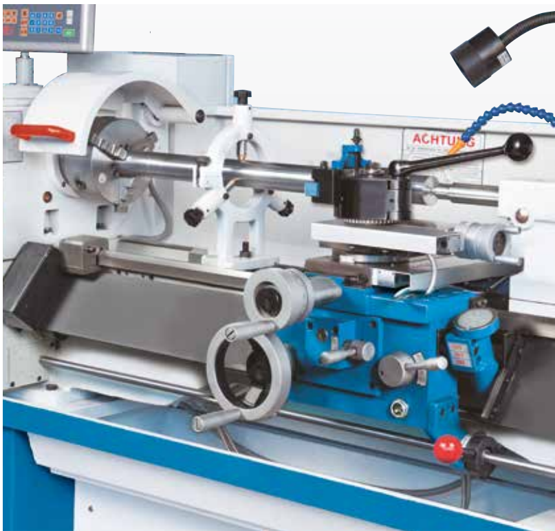
Lange Werkstücke werden in stabilen Lünetten abgestützt