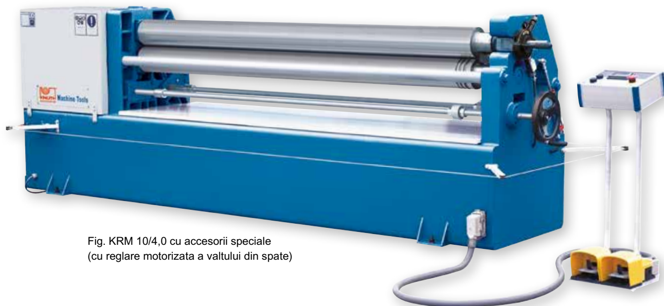
Fig. KRM 10/4,0 cu accesorii speciale (cu reglare motorizata a valtului din spate)