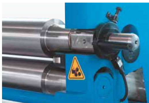
Rola superioară poate fi rotită afară