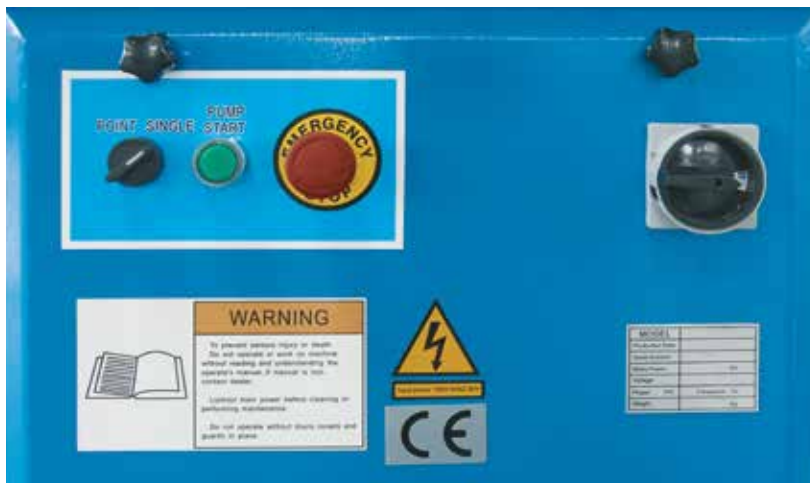
Станок впечатляет простотой и надежностью в эксплуатации