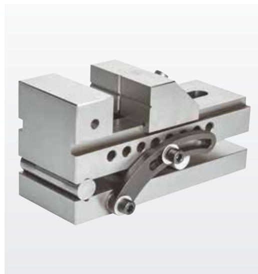
Menchina cu unghi reglabil pentru rectificarea (echipament Standard)