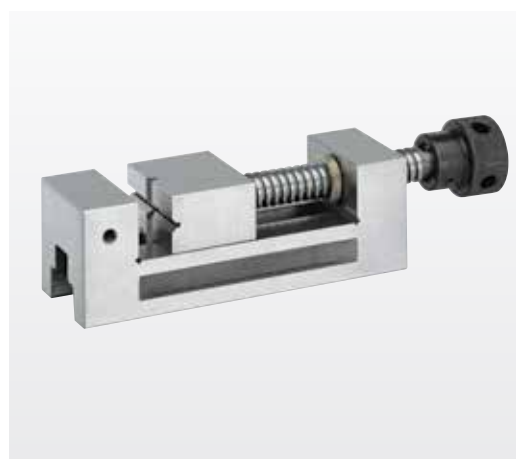
Fig. PSG 50 (optiune)