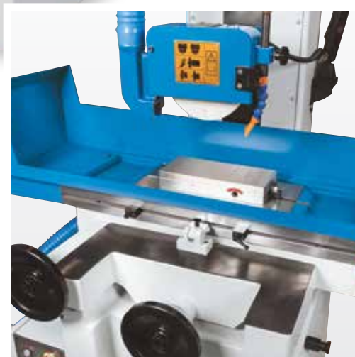
Masa de fixare magnetica permanenta cu pas fin intre spire, ideal pentru rectificari de precizie