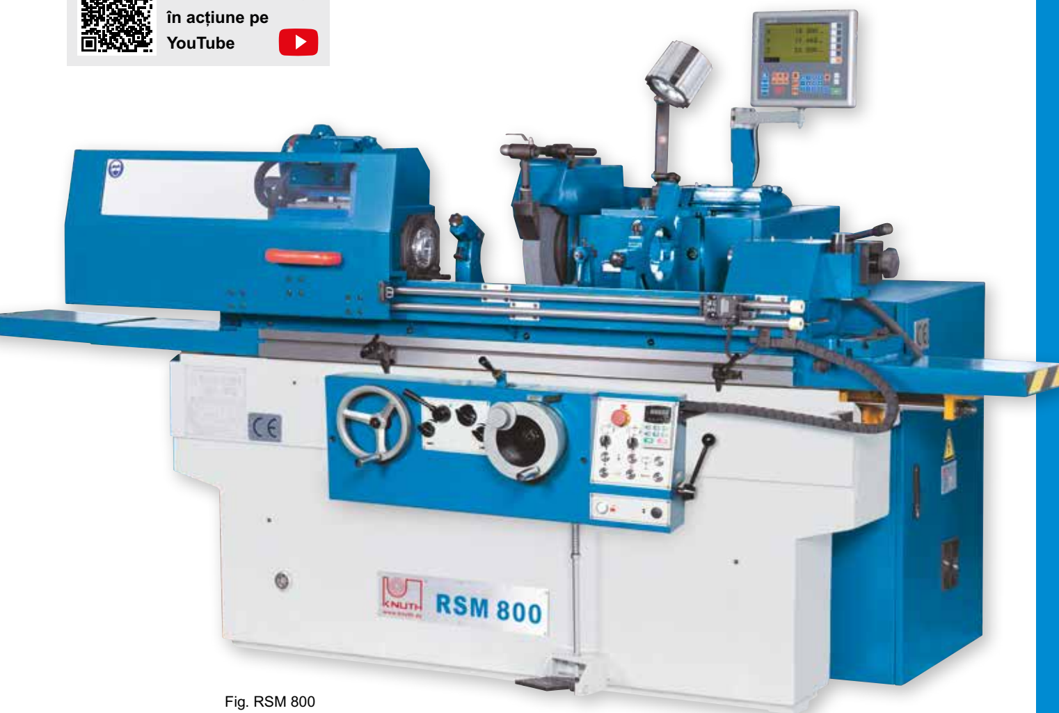
Fig. RSM 800