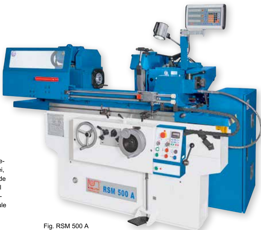
Fig. RSM 500 A