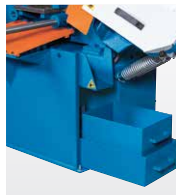
Rezervor de lichid de racire usor accesibil cu filtru mare pentru span