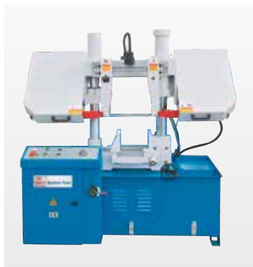
Fig. HB 280 T