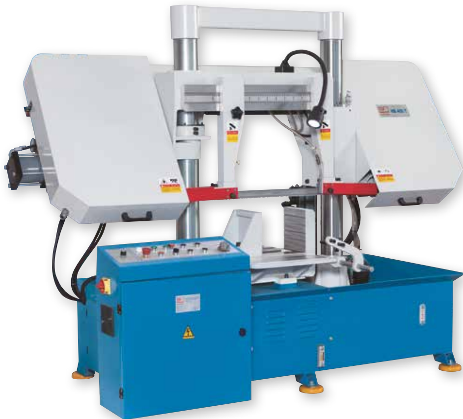
Fig. HB 400 T