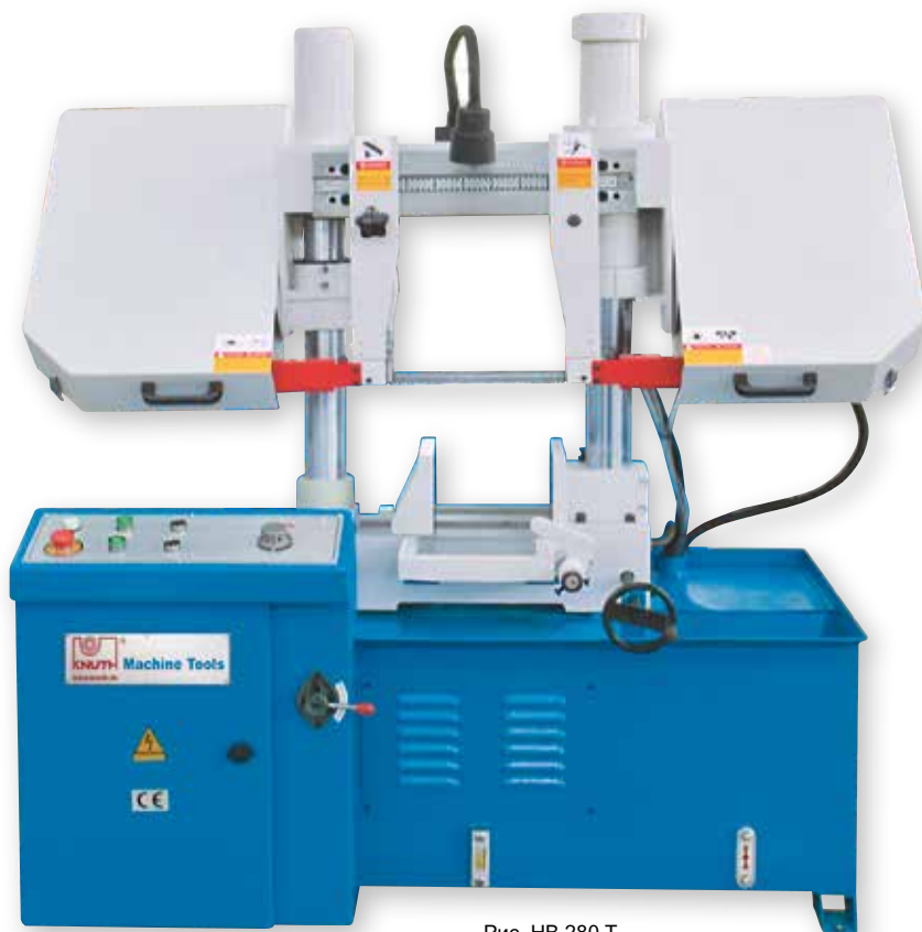
Рис. НВ 280 Т