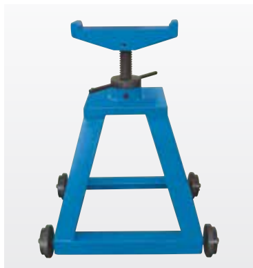
Стойка для опоры заготовки — только для НВ 280 Т