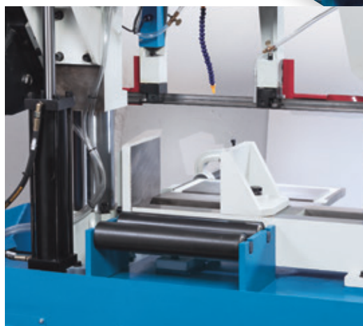
Rollenaufleger zur einfacheren Materialführung