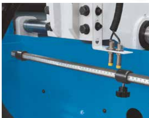
Avansul automat al piesei de prelucrare cu menghină mobilă, a cărei cursă este reglată de un opritor cu reglare manuală