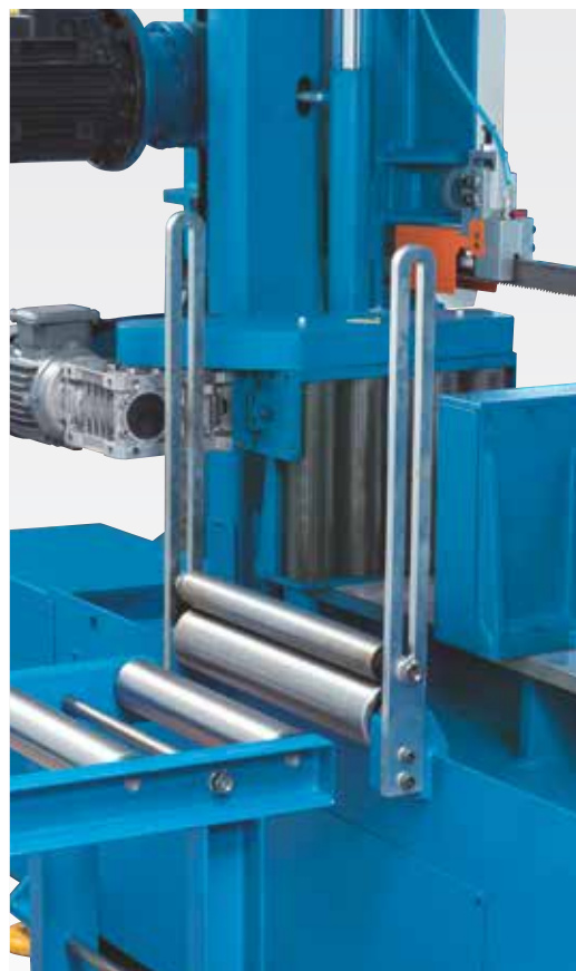
Bandă cu role de alimentare stabile și posibilitate de debitare in pachet