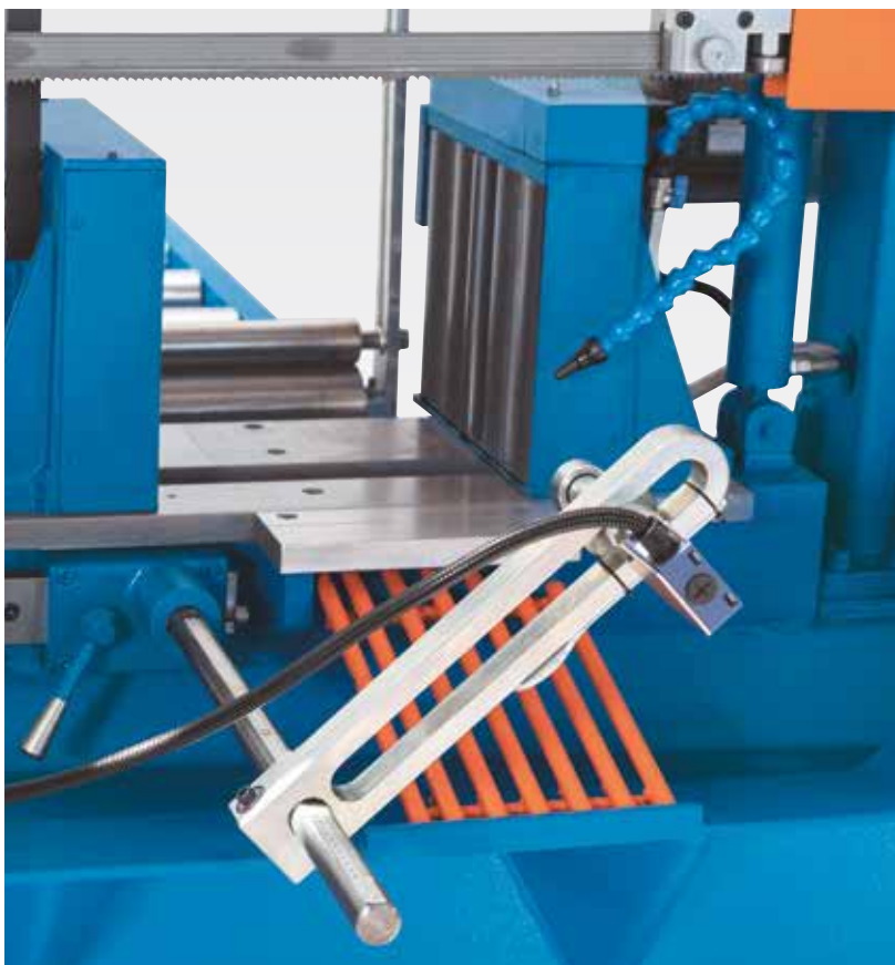
Rolele de avans antrenate se opresc automat cand materialul atinge opritorul