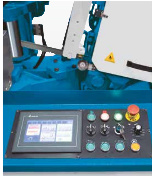
Der Touchscreen ermöglicht die leichte und übersichtliche Programmierung für den vollautomatischen Betrieb