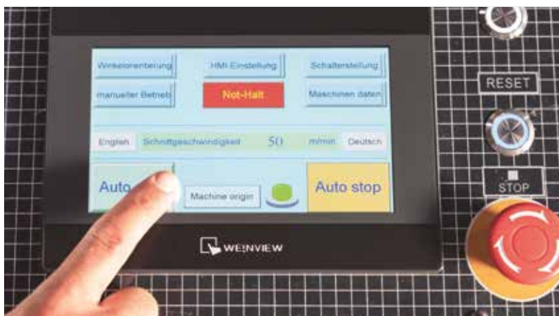
În modul automat pot fi programate lungimea avansului, unghiul de tăiere și numărul de pași din configurarea în cauză