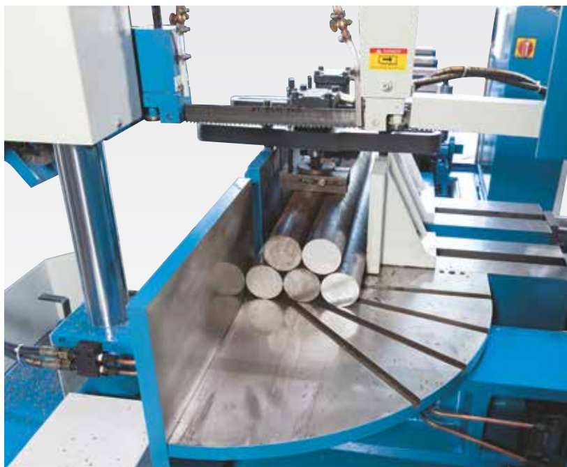
Instalație hidraulică tensionare fascicul pentru ambele menghine în serie