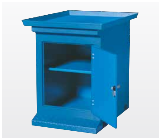
Batiu de masina universal cu spatiu de stocare, cod articol 123952