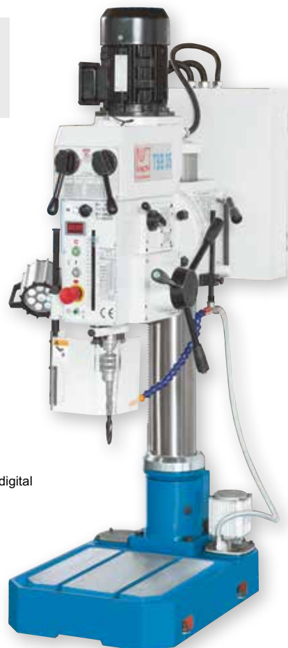
Fig. TSB 35 cu indicator digital de turatii

Pentru mai multe optiuni pentru aceste mașini consultați pagina noastră de internet la TSB (Căutare produs)