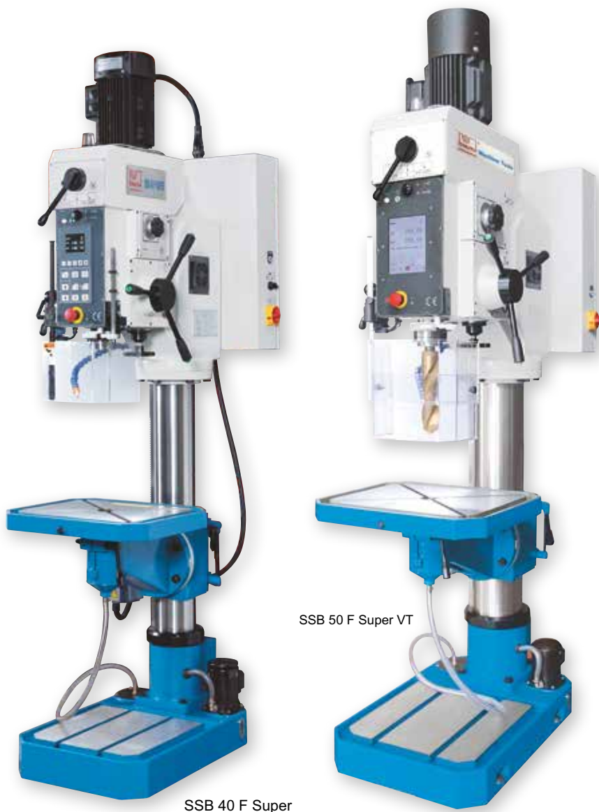
SSB 40 F Super