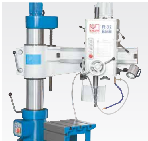
Brat rabatabil cu o degajare mare