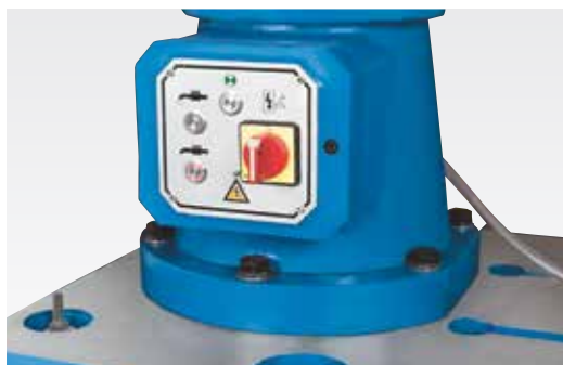
Suport rigid pentru coloana cu intrerupator principal central