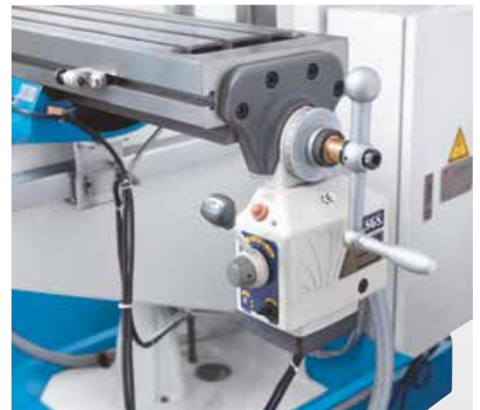
Avans reglabil în trepte pe axa X