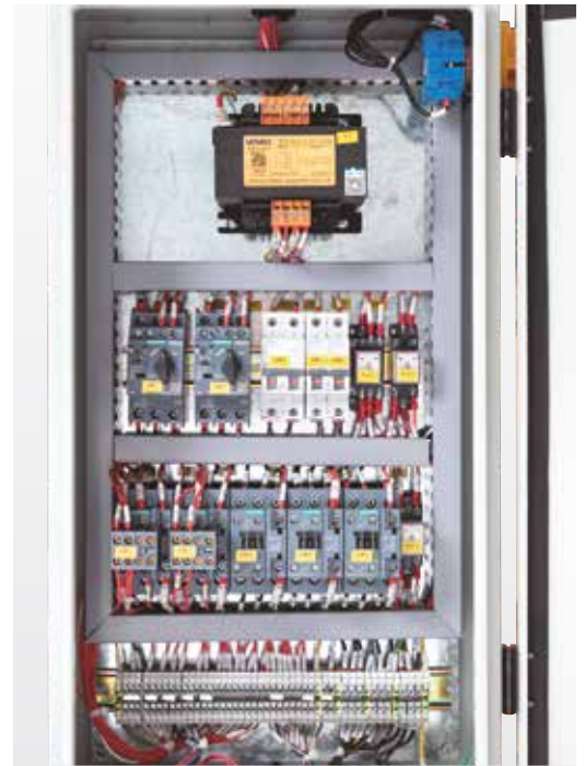
Componentele de înaltă calitate garantează fiabilitatea și siguranța