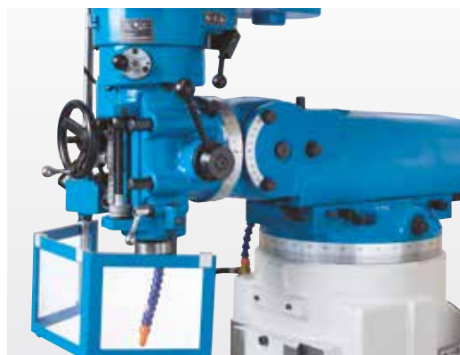
Głowica frezarska jest wychyłna i nachylana do otworów pod kątem