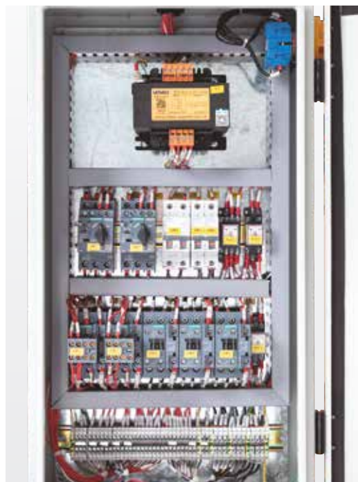
Vysoce kvalitní komponenty zaručují spolehlivost a bezpečnost