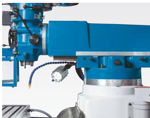
Variable Ausladung und Bearbeitungswinkel