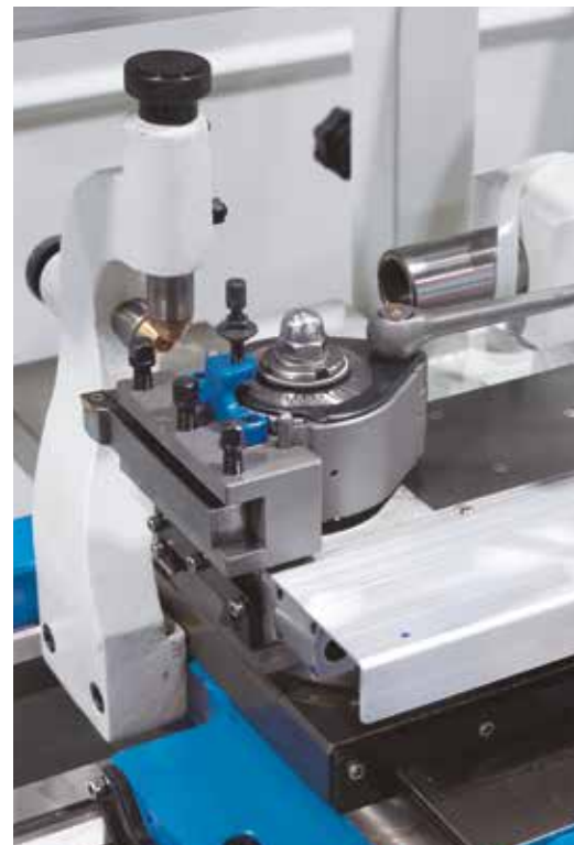
Cuțitele de strung pot fi rapid utilizate în sistemul de schimbător rapid de unelte