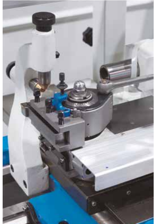
Im Schnellwechselstahlhaltersystem sind Drehmeißel schnell einsatzbereit