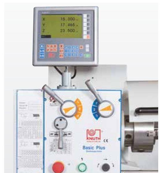
Positionsanzeige für X-, Z- und Z1-Achse