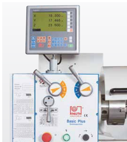
Zobrazení polohy pro osu X, Z a Z1