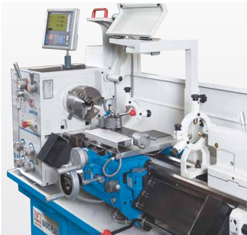
Pevná a pohyblivá luneta - sériově